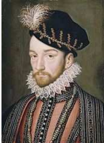
Charles IX de France

On peut distinguer huit guerres de religions : 1562-1563, 1567-1568, 1572-1573, 1574-1576, 1576-1577, 1579-1580, 1585-1598, la dernière se transformant en guerre classique contre le roi d'Espagne qui a soutenu la ligue [18] . En fait, la France connaît 36 années de troubles avec seulement deux périodes d'accalmie relative [18] .