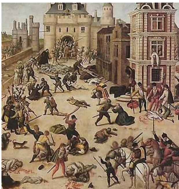
Massacre de la Saint-Barthélémy

Un article de Wikipédia, l'encyclopédie libre.