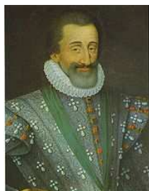
Édit de Nantes

Un article de Wikipédia, l'encyclopédie libre.